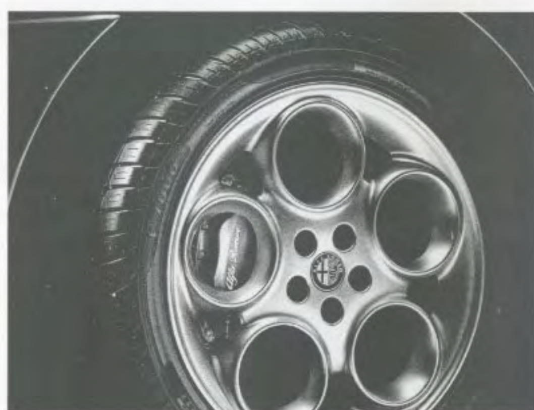
Leichtmetallfelge „Supersport“, Sonderausstattung auf Wunsch für 2.0 T.Spark und 2.0 T.Spark L, wahlweise ohne Aufpreis für 3.0 V6 24V L (Option 435).