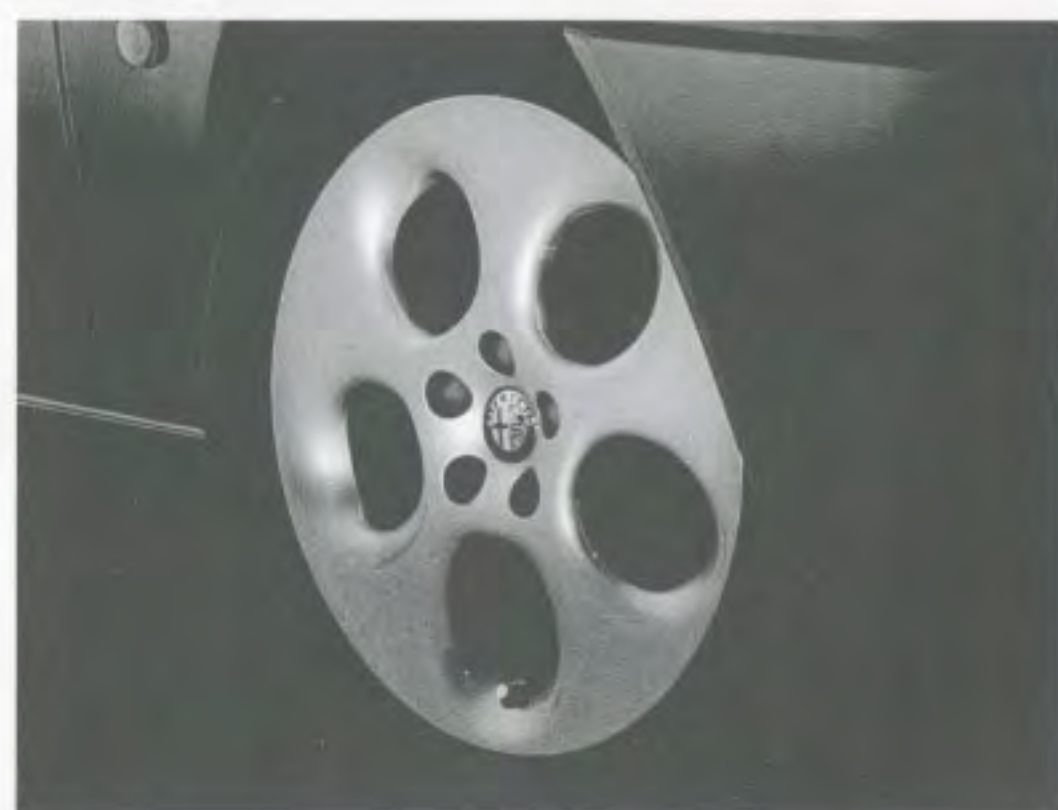
Leichtmetallfelge „Sport“, Sonderausstattung auf Wunsch für 2.0 T.Spark, serienmäßig für 2.0 T.Spark L und 3.0 V6 24V (Option 431).