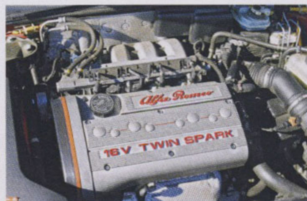
Der Zweilitermotor mit Doppelzündung und vier Ventilen pro Zylinder ist sehr drehfreudig

Nicht nur akustisch, auch in Sachen Fahrleistung sind die V6-Maschinen mit bis zu 240 PS im 3.2 V6 24V ein Quell der Freude, doch in diesen Versionen wird beim Gasgeben der Frontantrieb in den Händen am Lenkrad deutlich spürbar. Außerdem sind die Wartungskosten merklich höher als für den Vierzylinder, zum Beispiel beim Zahnriemenwechsel. Wer nicht unbedingt auf einen Alfa Spider der alten Schule fixiert ist, kommt mit dem Spider 916 zu einem offenen Zweisitzer, der viel Vergnügen bereitet – und das zu einem günstigen Preis.