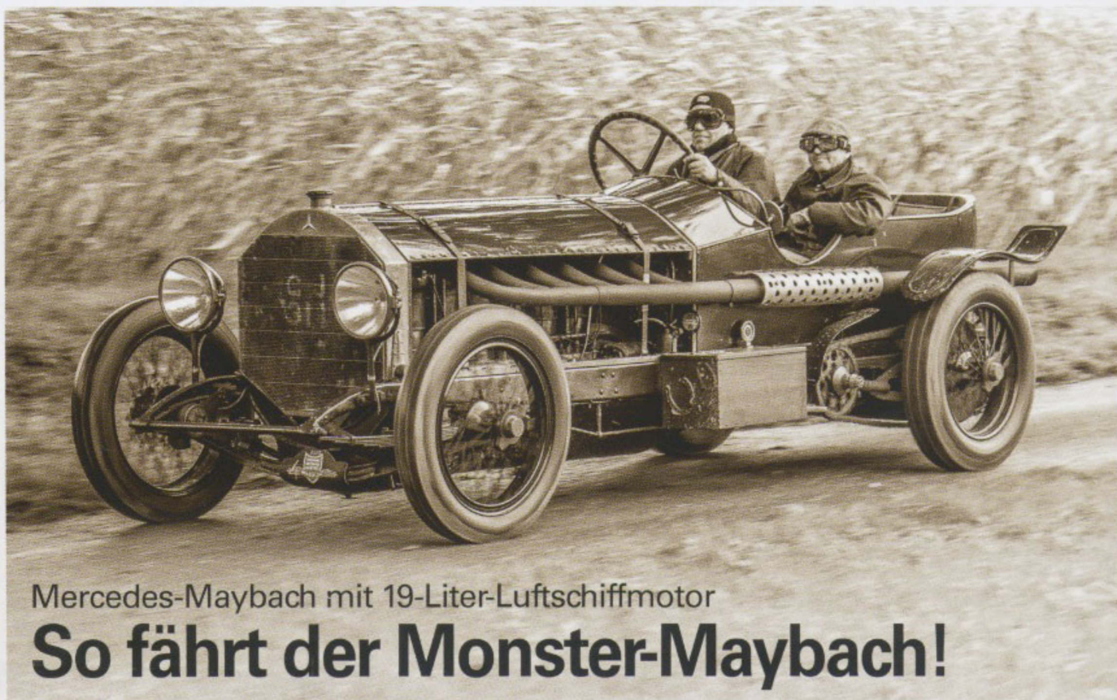
Mercedes-Maybach mit 19-Liter-Luftschiffmotor