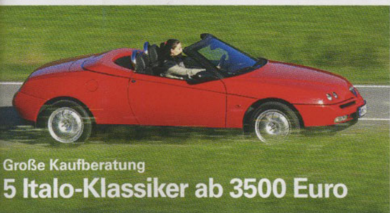
Große Kaufberatung 5 Italo-Klassiker ab 3500 Euro