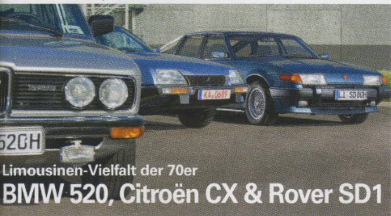
Limousinen-Vielfalt der 70er BMW 520, Citroën CX & Rover SD1