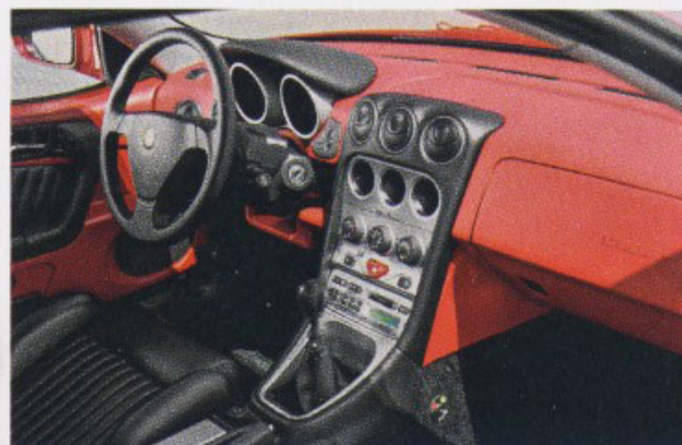
Das Cockpit zitiert den Spider Fastback mit „Eisbechern“ um Tacho und Tourenzähler

DER KULTURSCHOCK der Baureihe 916 verschreckte traditionelle Alfisti nachhaltig: Die bizarre Doppelkeilform, die eher als Skulptur eines Avantgarde-Künstlers durchgeht denn als stilsicherer Pininfarina-Entwurf, braucht Zeit, um zu gefallen. Der Paradigmenwechsel vom Transaxle-Antrieb an der Hinterachse zum Allwelts-Frontantrieb mit Quermotor musste mental verkräftet werden. Während der Spider noch mit der Faszination des Offenfahrens überzeugen konnte, tat sich der geschlossene Gran Turismo Veloce (GTV) beim Publikum schwer. Doch wer sich hinter das griffige Dreispeichenlenkrad setzt, darf sich freuen. Lederpolsterung und ein Cockpit im klassischen Stil machen Laune, der DOHC-16V-Vierzylinder mit Doppelzündung klingt bereits nach dem Anlassen unternehmungslustig. Sein kräftiger Durchzug im unteren Drehzahlbereich beeindruckt wie das Drehvermögen bis 7000/min. Das agile Handling lässt den Frontantrieb und die profane Plattformabstammung vom Fiat Tipo dank einer aufwendigen Fahrwerkskonstruktion mit Multilink-Hinterachse vergessen. Der GTV hat hintere Notsitze und ist exklusiver als der Spider. Das große Alfa-Thema Rost verlor dank Vollverzinkung seinen Schrecken.